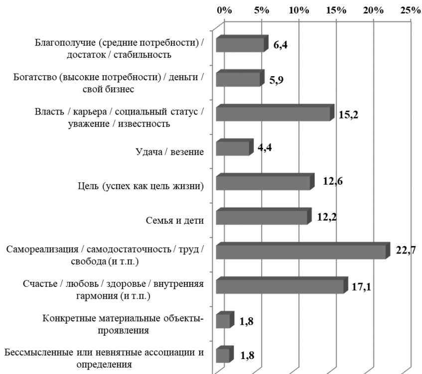
Рисунок 1. Ценностные ассоциации понятия «жизненный успех» (в % от числа опрошенных респондентов) [Самсонов, Морозова 2018]

Оказавшиеся в лидерах ассоциации наиболее контрастно на фоне аутсайдеров выделяются именно среди различных групп молодежи. Так, взгляд на