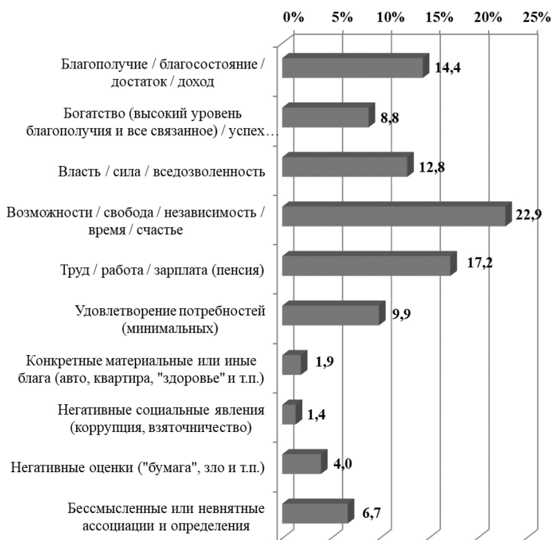
Рисунок 2. Ценностные ассоциации понятия «деньги» (в % от числа опрошенных респондентов) [Самсонов, Морозова 2018]

Проявляется своеобразный современный парадокс общественного сознания, когда обретение материальных ресурсов оказываются не целью жизненного успеха, но важнейшим инструментальным условием его достижения, т.е. опосредованно – одной из ключевых промежуточных задач. Особенно выражен этот парадокс в ответах молодежи в возрасте от 16 до 22 лет, среди которой 29% опрошенных ассоциируют деньги с возможностями, свободой, независимостью, счастьем, и еще 17,3% группы – с властью (карьерой) и силой.