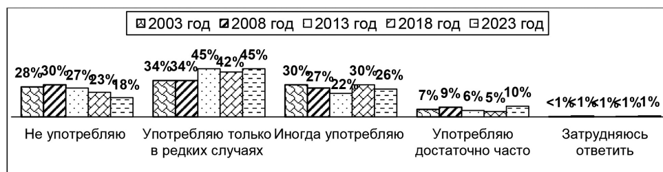
Рисунок 2. Распределение ответов на вопрос: «Употребляете ли Вы ненормативную лексику, и если да, то как часто?»

Прискорбно, что с каждым новым замером в последние годы снижается число респондентов с «чистыми устами»: от 30% до 18% (за 15 лет). Если с 2003 по 2013 гг. число воронежцев, иногда употребляющих ненормативную лексику, становилось все меньше, то в 2018 г. это число опять подпрыгнуло до значения 2003 г. (30%). Знаковый 2014 г. обрушил едва наметившуюся экономическую и политическую стабильность в стране, обострив как внутренние, так и международные противоречия. А на культурном уровне нестабильность всегда отражается в росте анонии, активации антисоциальных практик и всплеске ненормативной лексики.