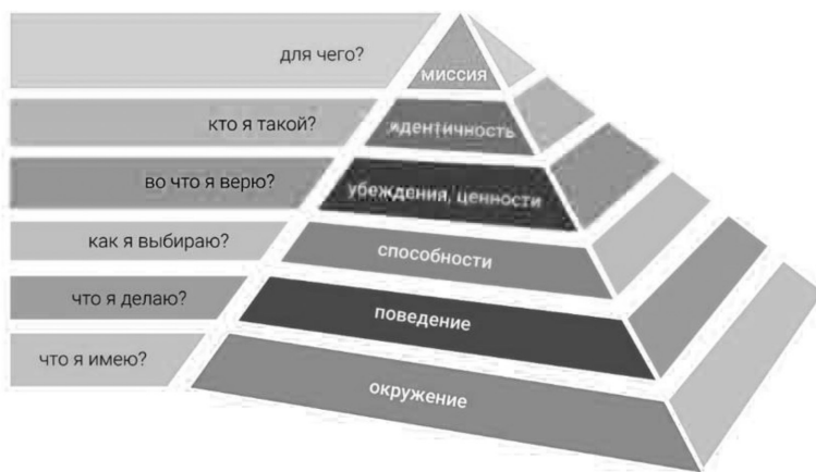
Рисунок 2. Пирамида нейро-логических уровней Дилтса

Анализ комикса «Приключения Никитки» как инструмента американских пропагандистских технологий при помощи «пирамиды Дилтса» позволит выявить: