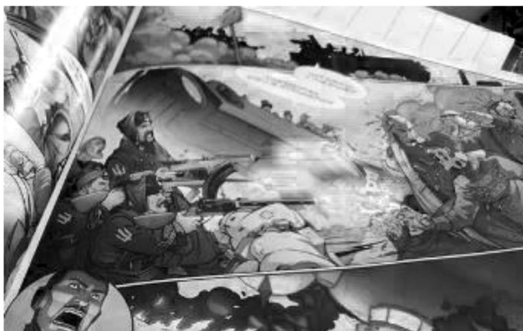
Рисунок 1. Элемент страницы комикса «Воля»

Вдобавок «альтернативные» псевдоисторические сноски закладывают искаженные представления о реальной роли Украины в мировой истории и отрицают все признанные достижения России 1 .