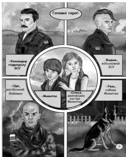
Рисунок 3. Страница № 1 из комикса «Приключения Никитки»