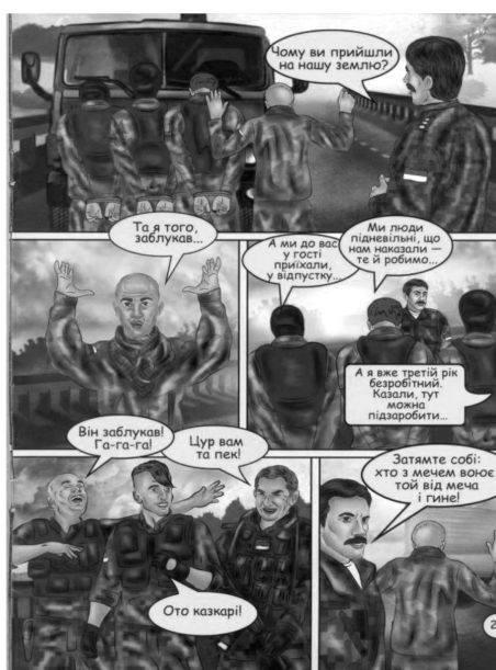
Рисунок 4. Страница № 29 из комикса «Приключения Никитки»