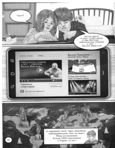
Рисунок 5. Страница № 12 из комикса «Приключения Никитки»