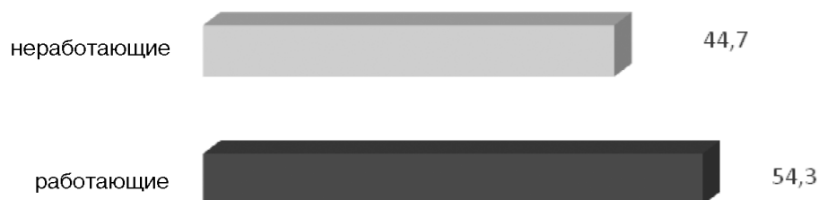
Рисунок 1. Распределение респондентов по уровню занятости, %

Обратимся к ключевым результатам, полученным в ходе опроса. Прежде всего нас интересует уровень занятости жителей региона. Ниже представлены данные, характеризующие уровень трудоустройства жителей Республики Тыва.