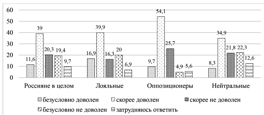
Рисунок 1. Уровень удовлетворенности российских граждан настоящим положением дел в личной жизни, в %

Результаты массового онлайн-опроса россиян демонстрируют четкую дифференциацию между удовлетворенными текущим положением дел в своей жизни в той или иной степени (50,6%) и неудовлетворенными (39,7%). При этом уровень персональной удовлетворенности определяется скорее микросоциальными, чем макросоциальными критериями (см. рис. 1). Особенности политической модальности россиян не оказывают существенного влияния на степень их личной удовлетворенности. В разрезе социально-демографических характеристик опрошенных не выявлены значимые гендерные различия, однако сильны межпоколенческие. Молодежь демонстрирует большую удовлетворенность собственной жизнью в текущий момент, чем старшие поколения (в той или иной степени удовлетворены молодежь 20 лет – 75,2%; от 20 до 24 лет – 68,5%; от 25 до 29 – 63,8%). Кроме того, фактором личной удовлетворенности можно считать уровень образования – люди с высшим образованием гораздо чаще демонстрируют удовлетворенность (54,1%), чем люди без такового (44,1%). Указанные результаты подтверждают преимущественно микросоциальный характер личной удовлетворенности и наличие комплекса субъективных факторов, определяющих социальное самочувствие. Несмотря на различия в методике опроса, полученные данные подтверждаются результатами регулярных замеров ВЦИОМа 1 .