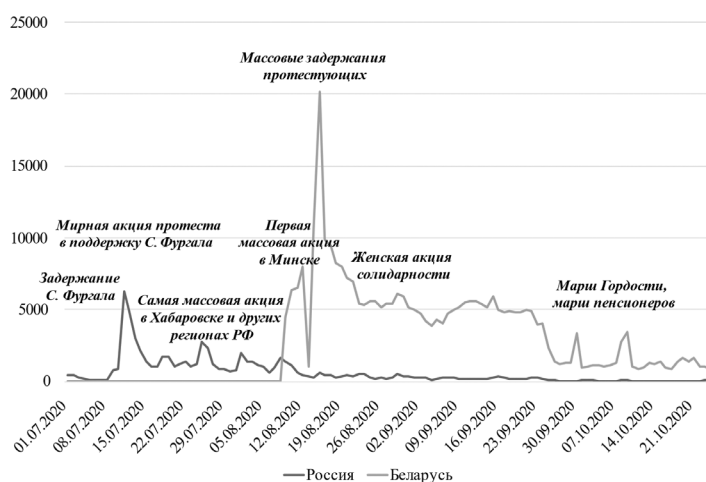
Рисунок 1. Ивент-анализ протестных информационных потоков в России и Беларуси в 2020 г.

Белорусские протесты продолжались с августа по ноябрь, а после трансформировались в пикеты, периодические немасштабные акции, а также онлайн-активность. Событийная повестка существенным образом дополняется акциями отдельных социальных групп: в конце августа проходят женские акции солидарности; в сентябре и октябре – акции пенсионеров и студентов, заявляющих о несогласии с результатами выборов и поддерживающих оппозицию. В белорусских протестах особую роль сыграли социальные медиа. Несмотря на блокировку Интернета непосредственно после выборов организация и модерация происходили за счет Telegram . Особую роль сыграл канал Nexta , который осуществлял распространение протестного контента, размещал инструкции и управлял протестами в реальном времени.