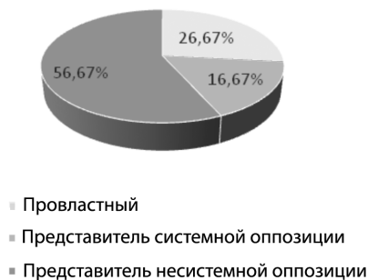
Рисунок 3. Распределение ответов на вопрос № 10, направленный на выявление отношения выбранного политика к действующей власти (провластный/оппозиционный)