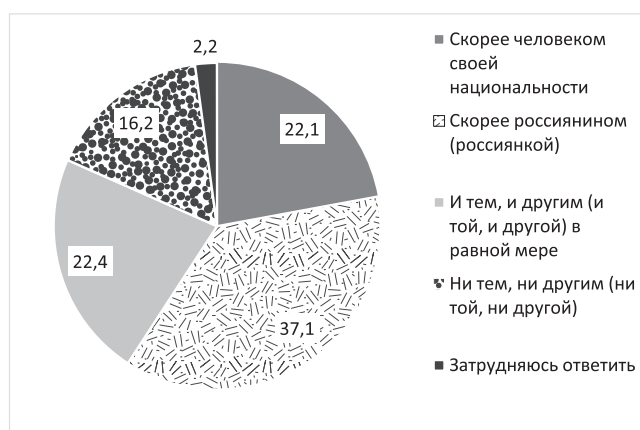
Рисунок 3. Распределение ответов на вопрос «Кем Вы себя чувствуете в большей мере?», %

Для оценки соотношения гражданской и этнической идентичности в опросе 2020 г. был задан вопрос о том, кем больше чувствуют респонденты – россиянином или человеком своей национальности. При анализе ответов на вопрос, кем респонденты чувствуют себя в большей мере, также наблюдается преобладание гражданской идентичности над этнической: 37,1 % считают себя скорее россиянином(кой), скорее человеком своей национальности – 22,1 %, и тем, и другим в равной мере – 22,4 %.