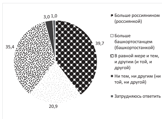
Рисунок 1. Мнение респондентов об их самоидентификации, %

Необходимо отметить, что особенность применения методики в вышеуказанном вопросе заключалась в том, что по всем видам идентификаций задавался отдельный вопрос, а не перечень вариантов ответов, которые можно сопоставить и выбрать наиболее соответствующий представлениям респондента. При этом в следующем вопросе «Кем Вы себя чувствуете в большей мере?» варианты ответов государственно-гражданской и региональной идентичности были приведены в одном вопросе.