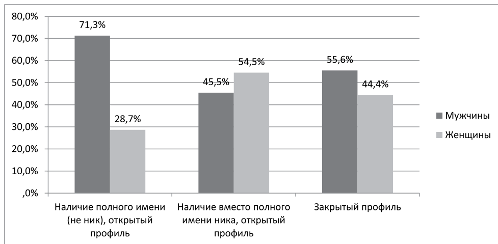
Рисунок 2. Статус аккаунта в зависимости от гендерной принадлежности автора, %

Гендерная принадлежность около 1/3 авторов аккаунтов (31,3%) неизвестна по разным причинам (ник вместо имени, закрытый профиль, аккаунт с запрещенным контентом). Из тех профилей, пол владельцев которых удалось идентифицировать, 67,7% – мужчины и 32,3% – представители женской гендерной группы. Таким образом, наличие меньшая включенность женщин во внешние информационные потоки влияния на Крым и Севастополь; фактически вдвое чаще склонна к вовлечению в данные потоки маскулинизированная гендерная группа.