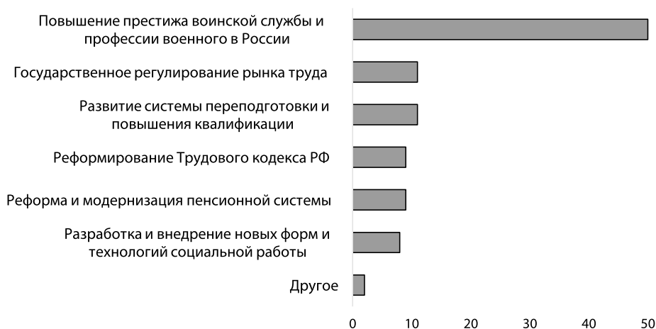
Рисунок 3. Наиболее реализуемые государством меры повышения эффективности социальной адаптации бывших военнослужащих, %

нацелена на поощрение добросовестной службы и на восполнение ряда их общегражданских прав и свобод. Иными словами, для социальной защиты военнослужащих характерны увеличенные размеры компенсационных выплат по сравнению с прочими категориями населения.