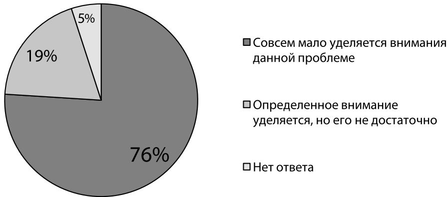
Рисунок 1. Линейное распределение ответов экспертов на вопрос: «Как Вы полагаете, в современной России достаточно ли уделяется внимания проблеме социальной адаптации граждан, уволенных с военной службы?»