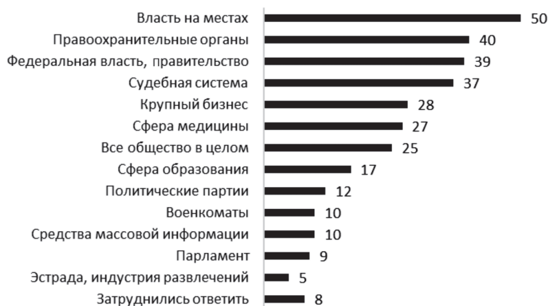
Рисунок 1. Распределение ответов на вопрос, какие институты и сферы жизни современной России, по мнению респондентов, в наибольшей степени поражены коррупцией, % (октябрь 2018 г.)

научно-исследовательским социологическим центром РАН в октябре 2018 г. в рамках мониторингового исследования «Динамика социальной трансформации современной России в социально-экономическом, политическом, социокультурном и этнорелигиозном контекстах» (далее – Мониторинговое исследование) 1 , позволил выстроить своеобразный рейтинг коррумпированности властных и общественных институтов, 1-е место в котором с большим отрывом заняла власть на местах (см. рис. 1).