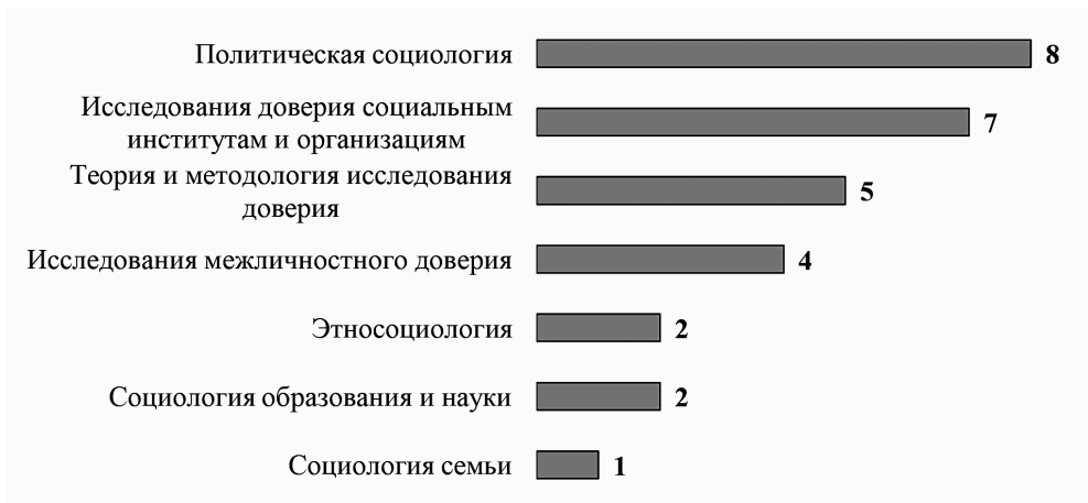
Рисунок 2. Распределение статей по тематикам 1

Тематическое распределение проанализированных публикаций позволяет говорить о распространении феномена доверия во всех сферах общественной жизни и соответствующем отражении в современном научном знании (см. рис. 2).