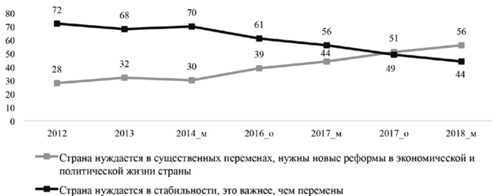
Рисунок 1. Динамика ориентации россиян на стабильность или перемены, 2012–2018 гг., %

внимание на то, что социологический опрос весной 2018 г. 1 продемонстрировал продолжение обозначившегося еще в 2016 г. протестного тренда — усиления запроса на перемены (см. рис. 1).