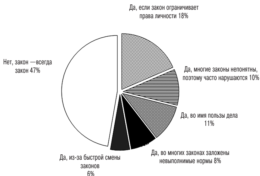
Рисунок 3. Допустимы ли нарушения законов? (закрытый вопрос, один вариант ответа)

Законность и порядок, по мнению свердловской молодежи, не занимают лидирующую позицию в демократии. На первом месте — возможность граждан влиять на решение государственных вопросов (см. табл. 2).