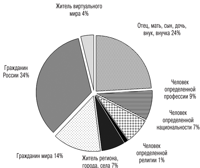
Рисунок 1. Как бы Вы ответили в первую очередь, кто Вы такой? (закрытый вопрос, один вариант ответа)

Под способностью группы к мобилизации понимается взаимодействие индивидов друг с другом с дальнейшим превращением в сообщество и формированием собственных организаций. Через создаваемые общественные организации происходит мобилизация социального ресурса. Важно, чтобы они взаимодействовали между собой, при этом формировали общие принципы и цели деятельности, согласовывали свои действия. Интенсивная и устойчивая связь превращает отдельные гражданские объединения и организации в гражданское сообщество, а оно уже может существенно влиять на общественную жизнь и способствовать формированию и поддержанию гражданского общества. Таким образом, про-