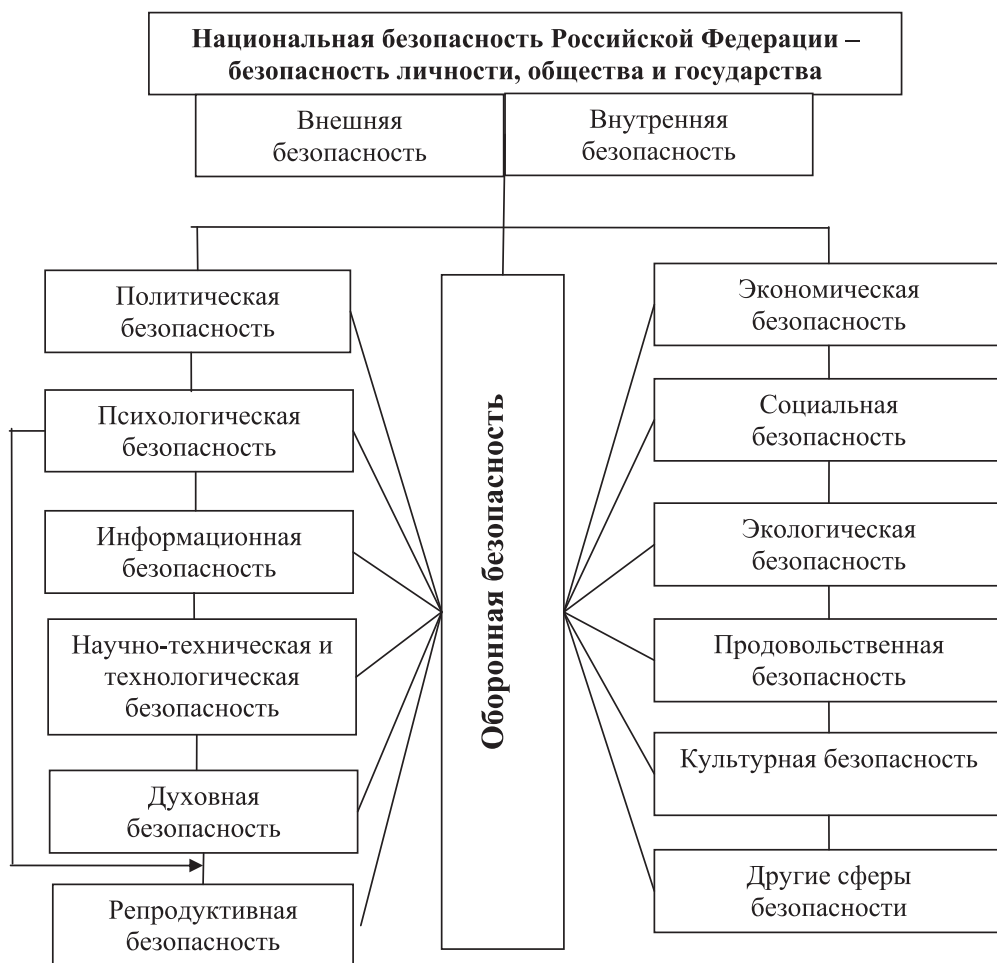
Рисунок 1. Морфология национальной безопасности

Практика государственного строительства и политические отношения выдвинули потребность в научной проработке всех структурных компонентов новой системы национальной безопасности и функциональных компонентов системы обеспечения национальной безопасности. Возникла потребность в определении сфер национальной безопасности, необходимость в научном анализе и прогнозировании реальных и потенциальных угроз жизненно важным интересам основных объектов национальной безопасности в ее структурных сферах: политической, экономической, оборонной, информационной и др. Каждая сфера национальной безопасности соответствует определенной сфере общественной жизни – политической, экономической, оборонной и т.д.