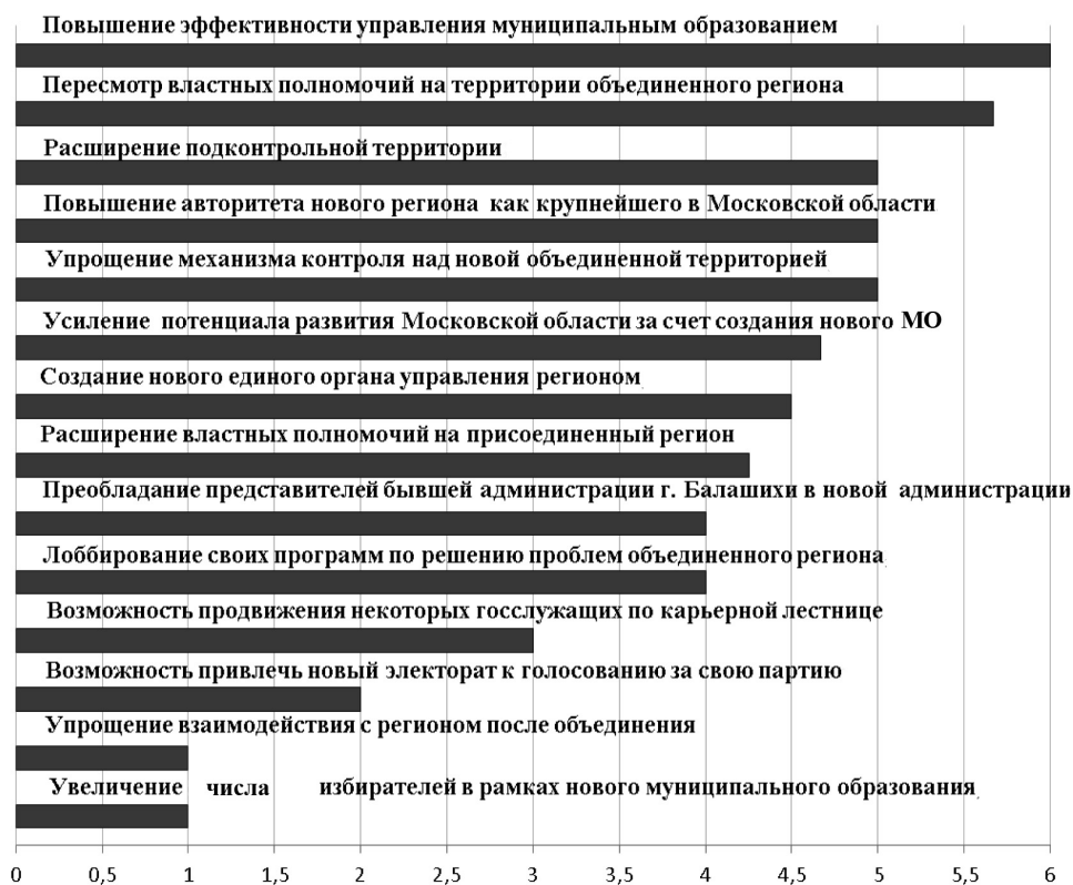
Рисунок 4. Ранжирование студентами политических интересов по степени реализуемости