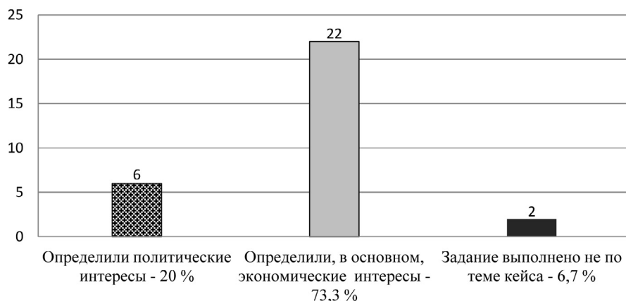
Рисунок 3. Выявление студентами конкретных политических интересов, реализуемых в ситуации объединения