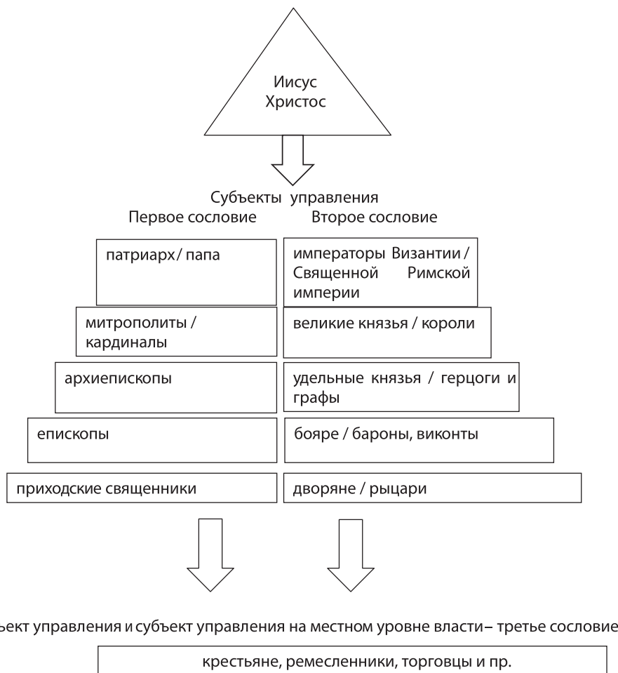
Рисунок 1. Схема теократического государственного управления христианским миром

в Западной Европе признавали императора Священной Римской империи и папу, в Восточной – византийского императора и патриарха (точнее, собор духовных лиц), поскольку с 1054 г. христианский мир окончательно разделился на католиков и православных. Формально в этой модели выделяются объект и субъект управления. Субъектом в первую очередь выступали первое и второе сословия. Однако же на местном уровне и третье сословие обладало политическими институтами управления в виде вечевых собраний, крестьянских сходов, казачьих кругов.