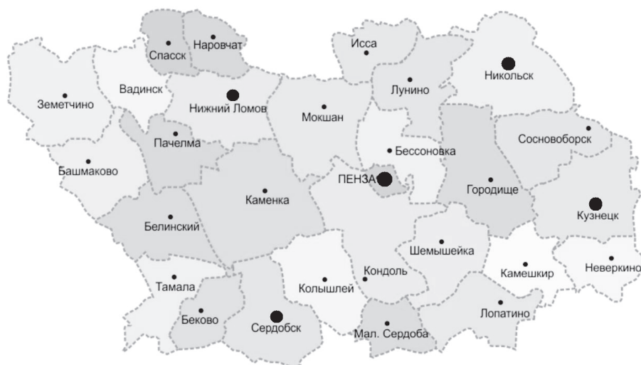
Рисунок 1. Карта Пензенской области

ные города. Население ориентируется на статус, работу, удобства и образ жизни, которые дают города. При этом наблюдается рост городов с числом жителей больше 500 тыс. чел. Это численность крупного города или столицы среднего субъекта федерации.