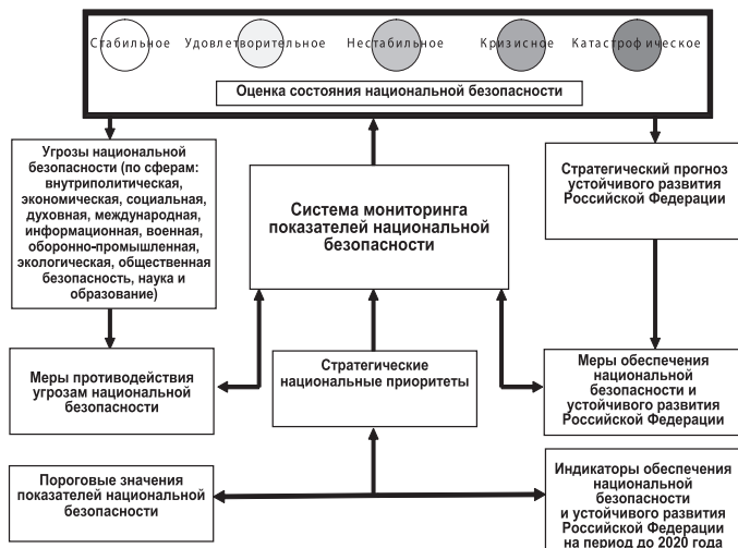
Рисунок 1. Обобщенная оценка состояния национальной безопасности РФ

ной безопасности, так и по каждому стратегическому национальному приоритету.