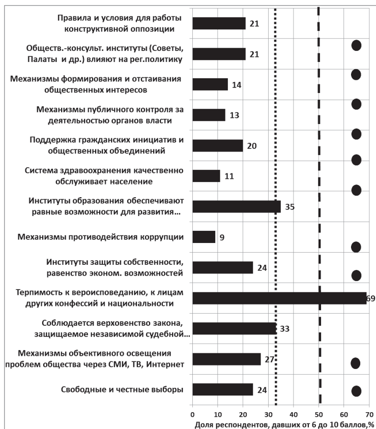
Рисунок 3. Оценка состоятельности институтов ПП, Костромская обл., 2012 г.

ских решений» (без обсуждения с другими акторами, без пилотной отработки в регионах) неминуемо возникают негативные последствия их реализации (социальные последствия монетизации льгот, получение полномочий без соответствующих материальных активов для МСУ, повышенные ставки страховых взносов для малого и среднего бизнеса и пр.), выходящие в ухудшении оценки состояния ПП гражданским обществом.