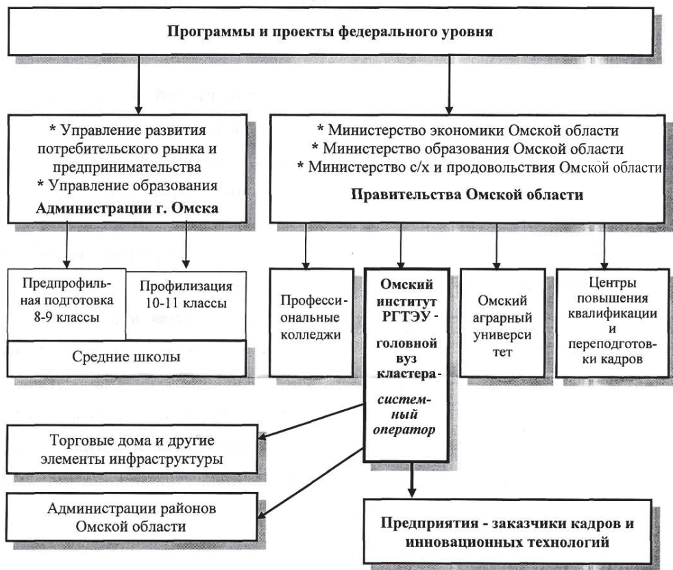
Рисунок 3. Структурная схема торгово-образовательного кластера в Омской обл.

национальный рынок как совокупность региональных рынков, поэтому практически все задачи, связанные с функционированием России в ВТО, должны и будут решаться на региональном уровне, т.е. стратегия устойчивого развития России в целом должна формироваться из совокупности стратегий устойчивого развития российских регионов. Возможности старой региональной экономической структуры, в целом, согласно проведенным исследованиям, не соответствуют запросам новой техники и технологий, т.е. сегодняшняя экономическая региональная структура не готова к изменениям.