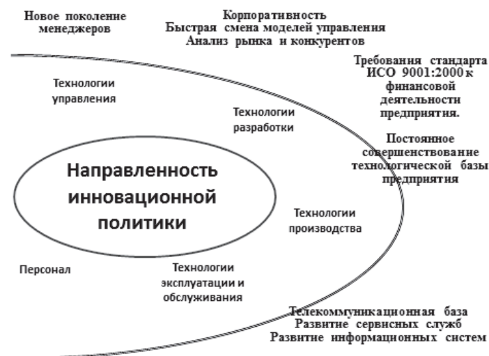
Рисунок 2. Условия подготовки реального сектора экономики к условиям ВТО

6. По госзакупкам, будет регулироваться Соглашением по госзакупкам ( TPRM – Trade Policy Review Mechanism ). Пока не подписано.