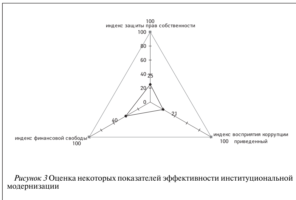
Рисунок 3 Оценка некоторых показателей эффективности институциональной модернизации

связью. Очевидно, что значительный уровень коррупции положительно коррелирует с высокой степенью зависимости судебной системы от других ветвей власти (законодательной и исполнительной) и сопровождается низкой степенью защиты прав собственности. В то же время неэффективная работа судов не только влечет за собой значительные затраты на восстановление нарушенных прав собственности, к которым относят, кроме финансовых издержек, еще и моральные, и временные,