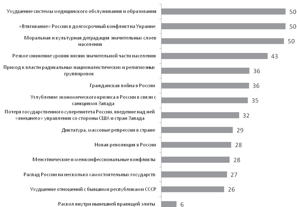
Рисунок 2. Степень опасений, испытываемых респондентами в отношении возможного развития различных событий и процессов в нашей стране, %

зования кредитных карт международных платежных систем и т.п. Но как только речь заходит о реальном «затягивании поясов» (замораживании зарплат и пенсий, повышении налогов), свыше 80% опрошенных высказываются против (см. табл. 1). Переоценивать готовность россиян идти на жертвы не стоит еще и потому, что многие из них готовы на самоограничение лишь в отношении того, что либо вообще не затрагивает их привычный уровень и образ жизни, либо затрагивает относительно незначимые их компоненты (скажем, легко отказаться от сбережений в валюте тем, у кого есть только рублевые сбережения или нет сбережений вовсе).