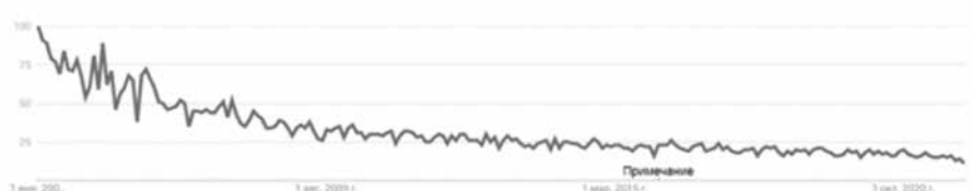
Рисунок 2. Динамический ряд ежемесячных значений относительной популярности запроса (ОП) «конфликт–тема» для всех стран мира

Источник: Google Trends. Период: 2004–2024 г. Дата запроса 19.08.2024 г.