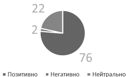
Рисунок 2. Отношение студентов столичных вузов к применению практик по устойчивому развитию в бизнес-процессах, %

Как Вы относитесь к инициативе применения ESG-практик и иных мировых тенденций в бизнесе?