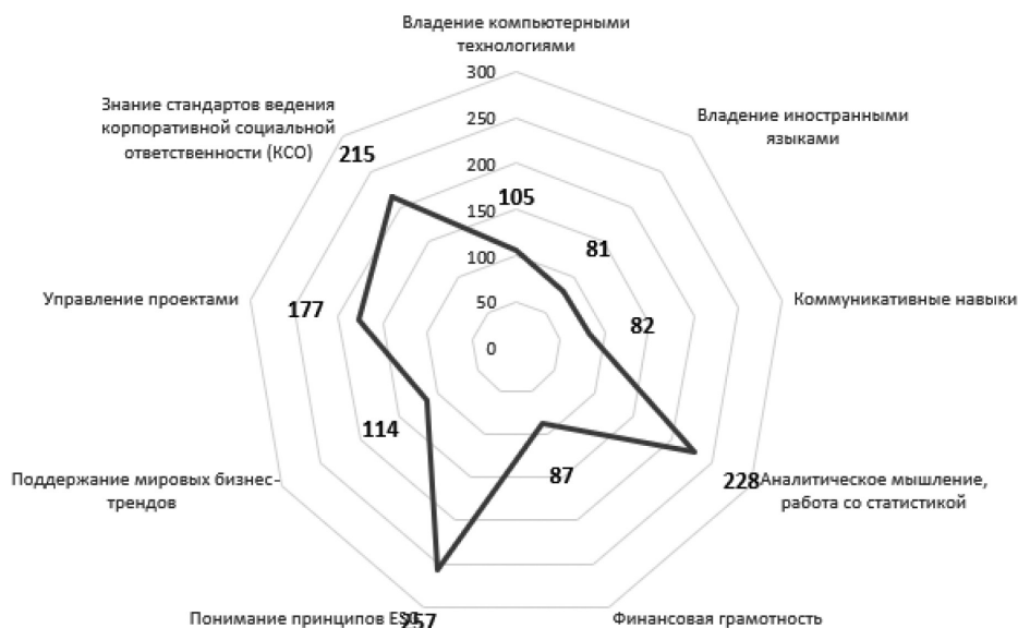
Рисунок 3. Навыки и знания, необходимые для работы в социально ориентированной компании с учетом принципов устойчивого развития

Как показывает рисунок, к сформированному ряду профессиональных навыков и личных качеств, необходимых сотруднику социально ориентированной компании, относятся следующие: знание стандартов ведения и применения принципов корпоративной социальной ответственности (КСО), управление проектами, финансовая грамотность, хорошие коммуникативные навыки. Кроме того, на основе исследования мы дополнили список основных профессиональных качеств, необходимых сотруднику.