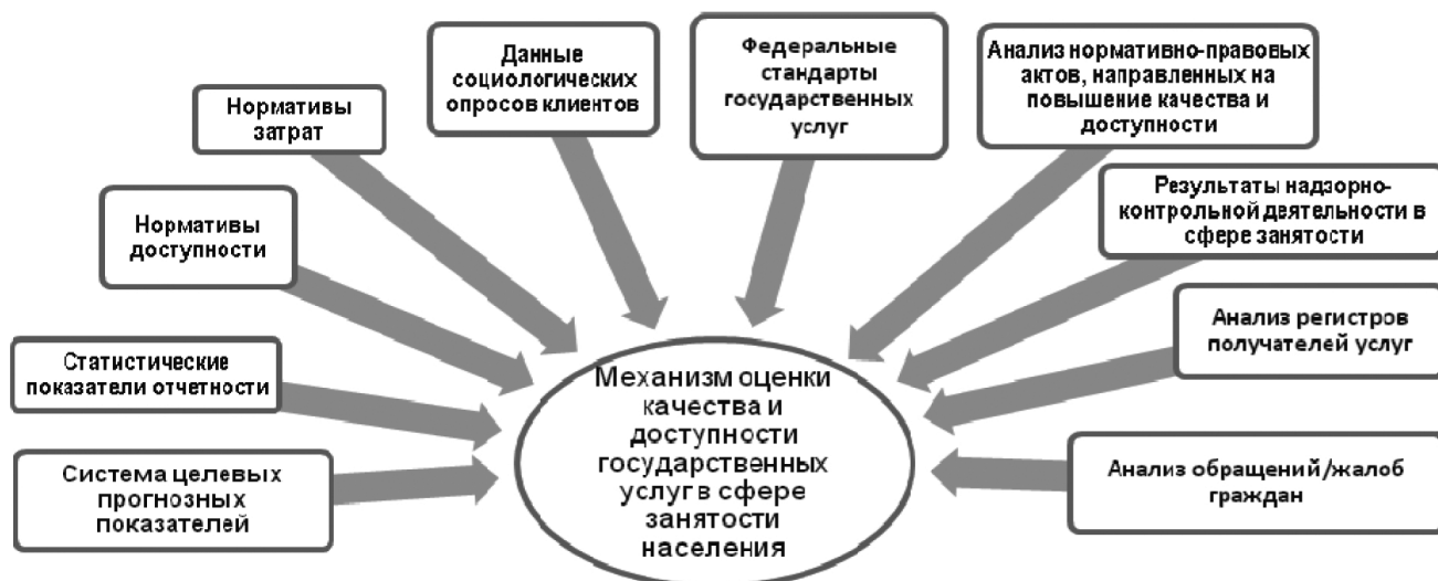
Рис. 1. Механизм оценки качества и доступности государственных услуг в сфере занятости