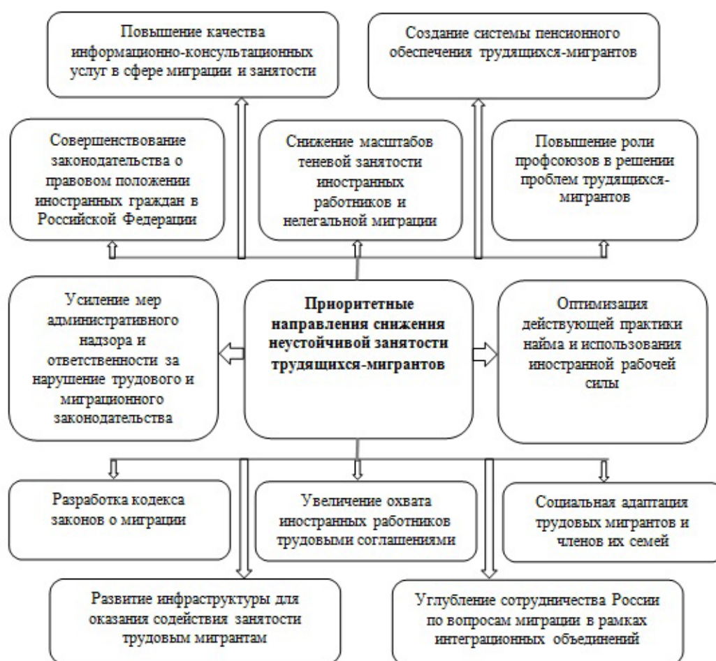
Рисунок 2. Приоритетные направления снижения неустойчивой занятости среди иностранных трудовых мигрантов в России