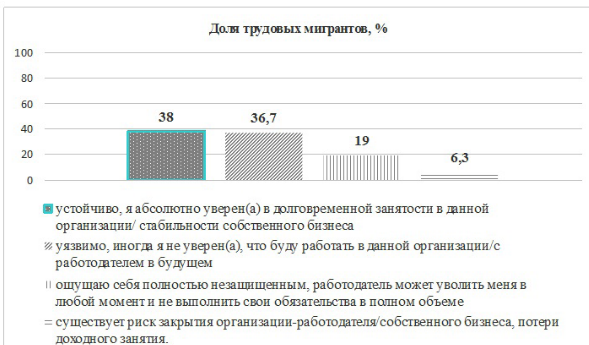
Рисунок 1. Оценка трудовыми мигрантами собственного положения и перспектив будущей занятости в России (результаты социологического исследования)

Характеризуя текущее положение и перспективы занятости в России, в ходе проведенного опроса трудящиеся-мигранты разделились во мнениях, при этом большинство ощущает себя незащищенными и неуверенными в будущей занятости при сохранении текущих условий труда (рисунок 1).