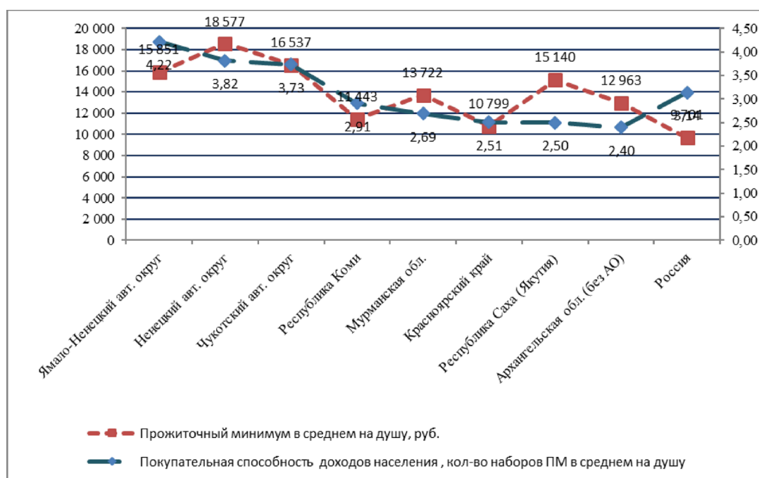
Рисунок 2. Прожиточный минимум и покупательная способность доходов населения в регионах Арктической зоны в 2015 г.

Источники: по прожиточному минимуму [9], покупательная способность рассчитана как отношение среднедушевых денежных доходов населения к величине прожиточного минимума.