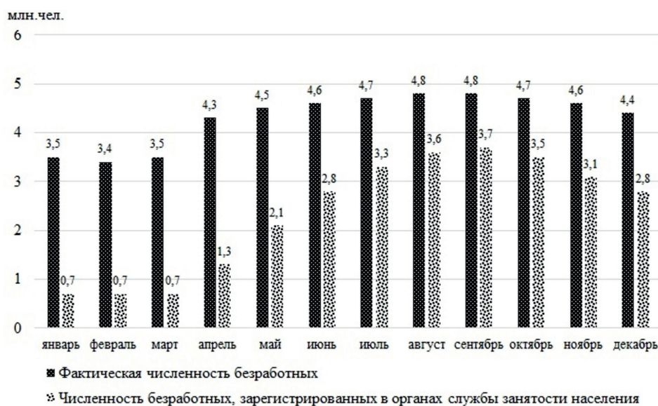
Рисунок 2. Динамика численности официально зарегистрированных и фактически безработных в России в 2020 г.