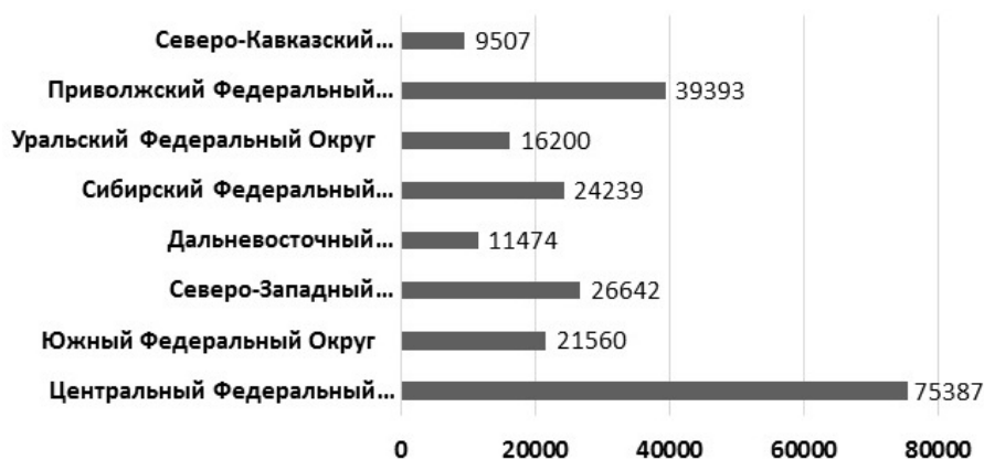
Рис. 1. Количество НКО в федеральных округах РФ

По результатам анализа зарегистрированных некоммерческих организаций доля НКО, работающих с семьей и детьми, составляет всего 0,9% от общего числа зарегистрированных негосударственных НКО. В масштабе России – это число незначительное. При этом российская семья нуждается в социальной поддержке по разным