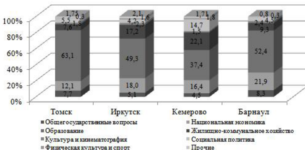
Рисунок 1. Структура расходов бюджетов городов СФО за 2017 год, %

В абсолютном выражении расходы на душу населения по всем основным разделам, кроме национальной экономики (3729,2 руб. на чел.), являются самыми низкими среди рассматриваемых городов. В то же время, сравнивая расходы бюджетов городов СФО в разрезе функциональной классификации, важно отметить, что в Барнауле удельный вес расходов по разделу «Общегосударственные вопросы» – 8,3%, в Иркутске – 5,1%,