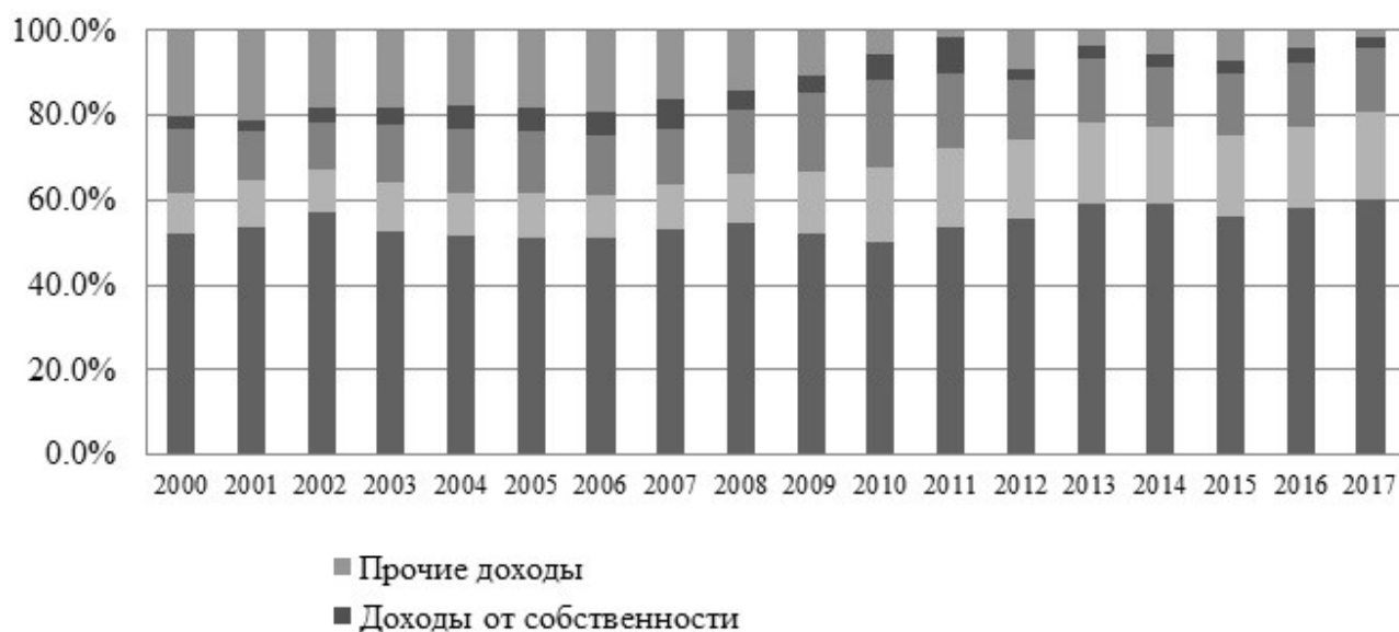
Рисунок 3. Структура денежных доходов населения в Якутии Picture 3. Cash Income Structure of the Population in Yakutia