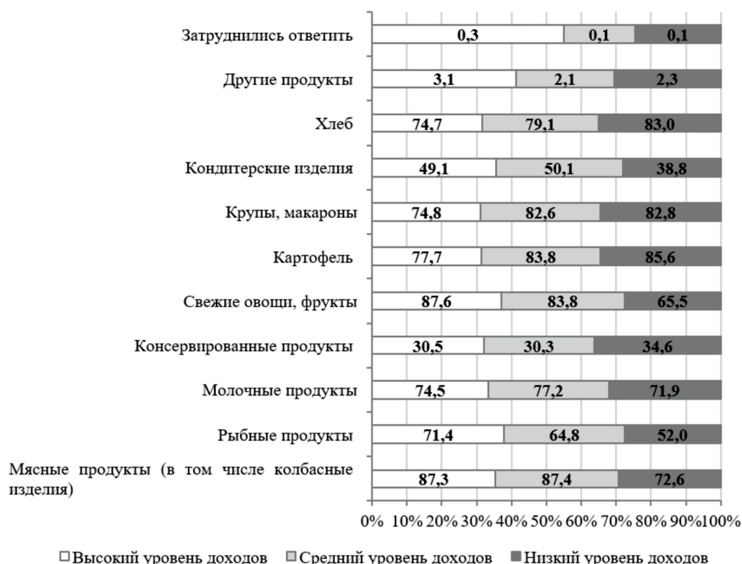
Рисунок 1. Основные продукты, входящие в ежедневный рацион питания населения в группах с разным уровнем доходов, в процентах

Следует также отметить, что действующая модель питания трудоспособного населения формируется, исходя из физиологических особенностей организма работающих, не занятых тяжёлым физическим трудом [12], в том числе не занятых