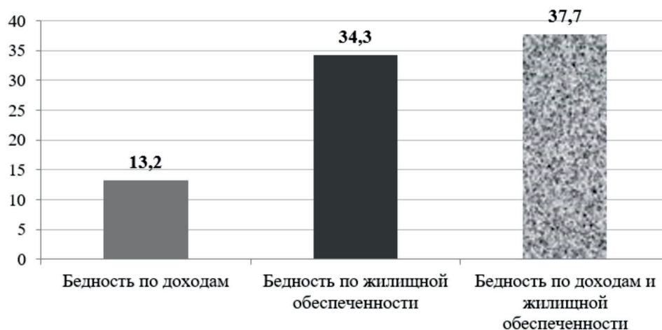
Рисунок 3. Уровень бедности на основе критериев доходов и жилищной обеспеченности в целом по России, 2017 г., в процентах от численности населения