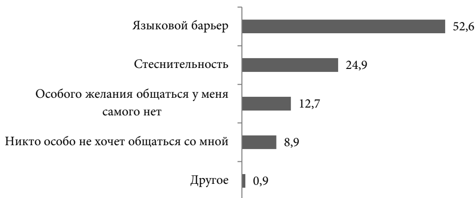
Рис. 4. Факторы, препятствующие общению респондентов с местными студентами, 2017 г., %

Из данных рис. 3 видно, что каждый второй респондент в той или иной степени находится на стадии приспособления к условиям мест прибытия и обучения, пребывая там до двух лет (51,9%). Остальных респондентов (47,1%) можно считать более адаптировавшимися в местах локализации. Большинство респондентов (75%) ответили, что привыкали «недолго и достаточно легко» к новой студенческой жизни в России, а «привыкала долго и трудно» малая доля студентов (10%). Здесь можно предположить, что если индивид прибывает в определённое время и с определённой целью на новое место жительства, в данном случае — на обучение, то ему легче приспособиться к «известным» обстоятельствам, нежели тем, кто всё «начинает» в условиях неопределённости. Притом почти каждый второй опрошенный оценил уровень владения русским языком так: «могу объясняться на простые темы, владею разговорным/бытовым языком» (53,7%); свободно владеют языком, то есть разговаривают, читают и пишут 7,5%. Конечно, помимо всех других условий, иностранец может поддерживать коммуникацию, основываясь на знании и ресурсах языка.