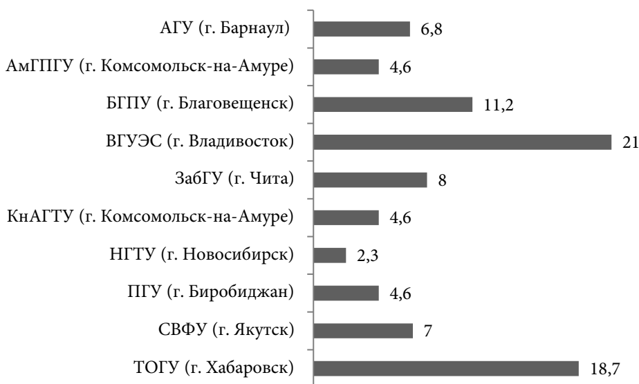
Рис. 2. Распределение респондентов по вузам и городам Сибири и Дальнего Востока России, 2017 г., %

Анкета состоит из 69 вопросов, разделённых на блоки: образование в КНР; образование в РФ; адаптация в российском вузе; удовлетворённость качеством образования и будущее трудоустройство; досуг, общение, быт; «паспортичка». Для обработки данных использовалось программное приложение IBM SPSS Statistics 22.