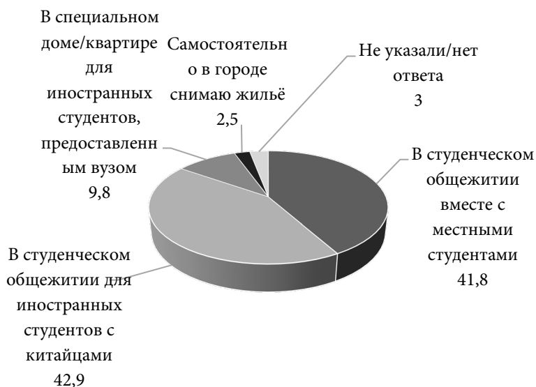
Рис. 5. Места проживания респондентов на момент опроса, 2019 г., %

Не меньшее значение имеет место проживания китайских студентов в общежитиях вузов ДВ РФ (см. рис. 5).