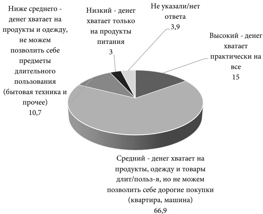
Рис. 6. Оценка респондентами материального уровня жизни своей семьи, 2019 г., %

Структура пяти суммированных долей ответов респондентов, объясняющих выбор специальности, красноречиво говорит о том, как возрастает сложность организации профессиональной деятельности и как на это приходится реагировать будущему поколению специалистов.