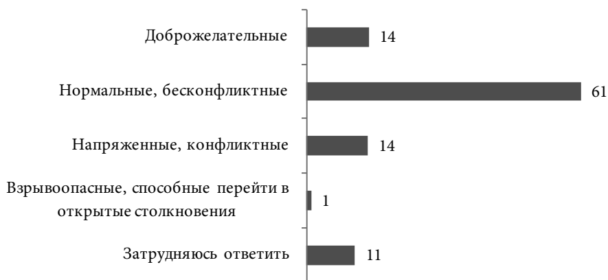
Рис. 1. Оценка межнациональных отношений в РС(Я), 2020 г., %

На фоне общероссийских данных оценки межнациональной ситуации, сложившейся в Республике Саха (Якутия), выглядят достаточно благоприятно (рис. 1).