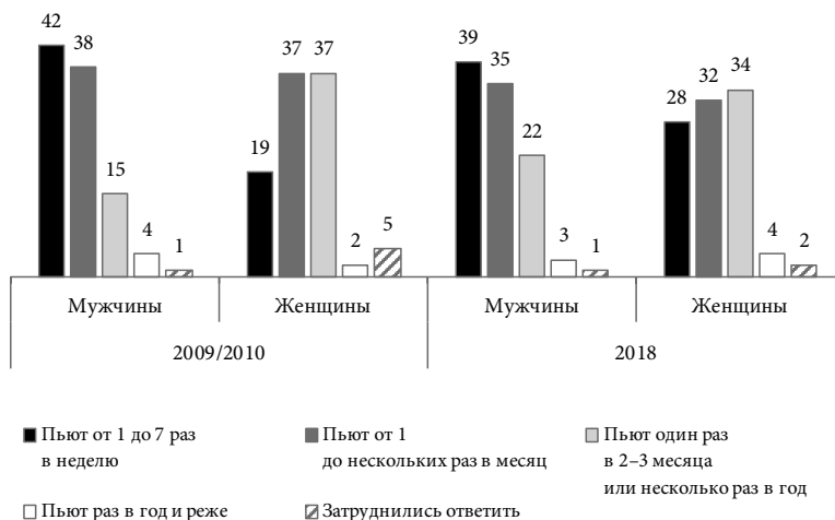
Рис. 1. Частота употребления спиртных напитков у мужчин и женщин, 2009 / 2010 и 2018 гг., доля от ответивших в группе, %

сохраняют количественный и ситуационный контроль — отметили, что выпивают больше, чем планировали, почти каждый второй мужчина и лишь каждая третья женщина. Сильное опьянение и практика опохмеляться остаются нормой мужского алкогольного поведения (рис. 2). Неоднократно напивались до состояния сильного опьянения в течение года 10% мужчин и 5% женщин, а пару раз за год — 27% мужчин и 16% женщин. Периодически опохмеляющихся женщин в 3,5 раза меньше, чем мужчин (в 2009 / 2010 г. — почти в 6 раз меньше).