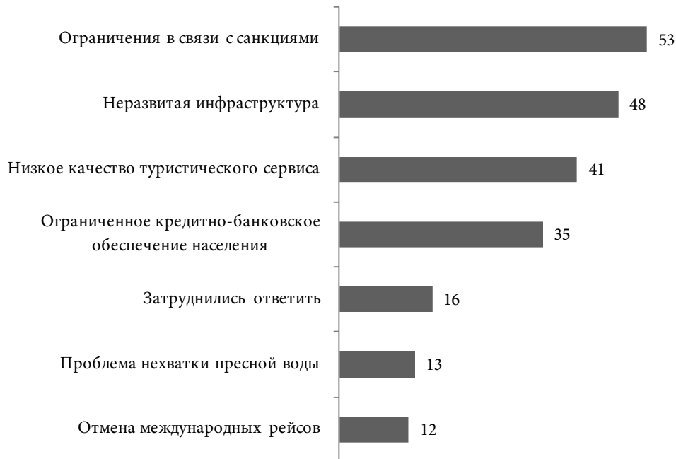
Рис. 2. Распределение ответов на вопрос: «Какие социально-экономические проблемы Крыма требуют повышенного внимания федеральных властей?», %

Отвечая на вопрос о том, какие социально-экономические проблемы Крыма требуют повышенного внимания федеральных властей (многовариантный выбор), россияне выделили такие проблемы, как неразвитость инфраструктуры, низкое качество туристического сервиса, проблемы кредитно-банковского обслуживания населения, нехватка пресной воды и невозможность воспользоваться прямыми международными рейсами (см. рис. 2). Ряд этих проблем напрямую связан с санкционным давлением, преодоление которого также отмечалось респондентами как задача для федерального правительства.