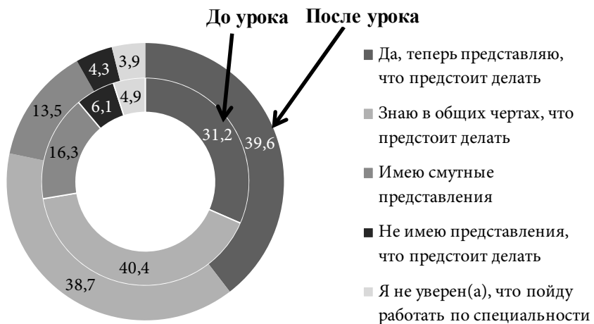
Рис. 2. Распределение ответов на вопрос: «Представляешь ли ты себе характер и содержание будущей профессиональной деятельности?», опрос «до» и «после» урока, %

Верное представление о характере и содержании будущей профессиональной деятельности — основа осознанного подхода к выбору профессии, поэтому при опросе для выявления эффективности проведённого мероприятия «до» и «после» урока обучающимся был задан вопрос «Представляешь ли ты себе характер и содержание будущей профессиональной деятельности?». Сопоставление ответов на вопрос «до» и «после» урока показало эффективность Всероссийского профориентационного урока «Начни трудовую биографию с Арктики и Дальнего Востока!» и разработанных для его проведения методических инструментариев. По данным, представленным на рис. 2 видно, что после получения информации на уроке повышается доля тех, кто полностью представляет, чем предстоит заниматься в будущем.