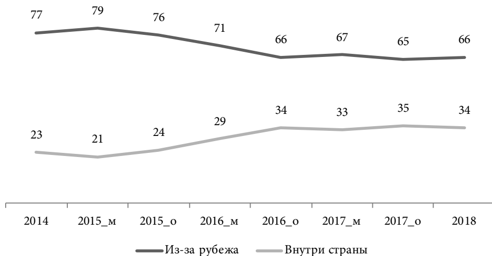
Рис. 2. Динамика оценок россиянами основного источника угроз для России, 2014–2018 гг., %*

российского общества таковыми. К примеру, популярное ещё несколько лет назад мнение, что западные санкции не представляют никакой угрозы экономике России и благосостоянию её граждан, сегодня разделяют лишь четверть опрошенных россиян. Ещё меньше тех, кто продолжает считать, что, живя в России и получая зарплату в рублях, можно не обращать внимание на колебания курса доллара и рубля на валютном рынке.