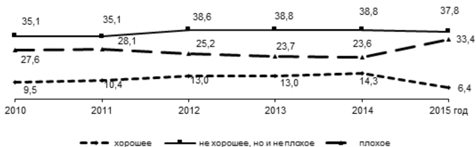
Рис. 4. Оценка целесообразности покупки автомобиля, среднегодовые данные, %*

*Вопрос задаётся с 2010 г. и звучит следующим образом: «Как Вы думаете, сейчас в целом хорошее или плохое время для того, чтобы покупать автомобиль?»