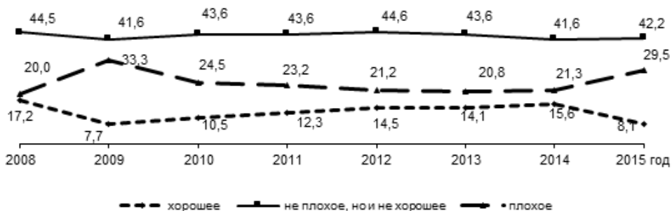
Рис. 3. Оценка целесообразности совершения крупных покупок длительного пользования, среднегодовые данные, %*

Эти явления отмечаются и на региональном уровне. Жители области стали более скептически относиться к приобретению дорогостоящих вещей и к кредитам. За период с 2013 по 2015 г. увеличилась доля жителей области, полагающих, что сейчас «плохое» время для крупных покупок, таких как мебель, холодильник, бытовая техника, телевизор и т. д. (на 8,2 п. п.: с 21,3 до 29,5%; см. рис. 3), а также для приобретения автомобиля (на 9,8 п. п.: с 23,6 до 33,4%; см. рис. 4). Вырос удельный вес людей, убеждённых, что в нынешних условиях лучше не брать кредит (на 13,3 п. п.: с 35,2 до 48,5%; см. рис. 5).