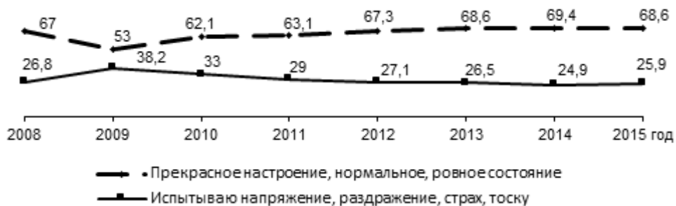
Рис. 1. Динамика социального настроения населения Вологодской области, % (приводятся среднегодовые данные)

Однако в 2015 г., несмотря на экономический кризис и ухудшение материального положения, социальное настроение жителей области осталось на уровне докризисного 2013 г.: доля положительных отзывов достигает 69%, отрицательных – 26–27% (см. рис. 1). Для сравнения: в период предыдущего кризиса (2008–2009 гг.) доля людей, характеризующих своё настроение как «прекрасное», «нормальное», «ровное», снизилась на 14 п. п. (с 67 до 53%); удельный вес тех, кто испытывает напряжение, раздражение, страх, тоску, вырос на 11 п. п. (с 27 до 38%). В этом заключается проблема исследования.