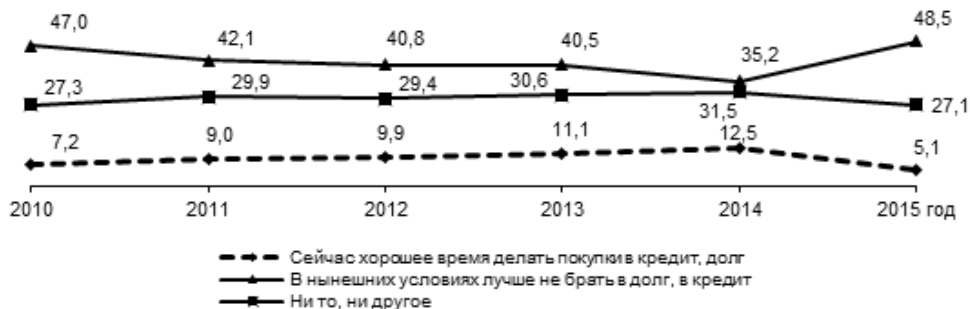
Рис. 5. Оценка целесообразности приобретения товаров в долг, кредит, среднегодовые данные, %*

*Вопрос задаётся с 2010 г. и звучит следующим образом: «Как Вы думаете, сейчас в целом хорошее или плохое время для того, чтобы покупать автомобиль?»