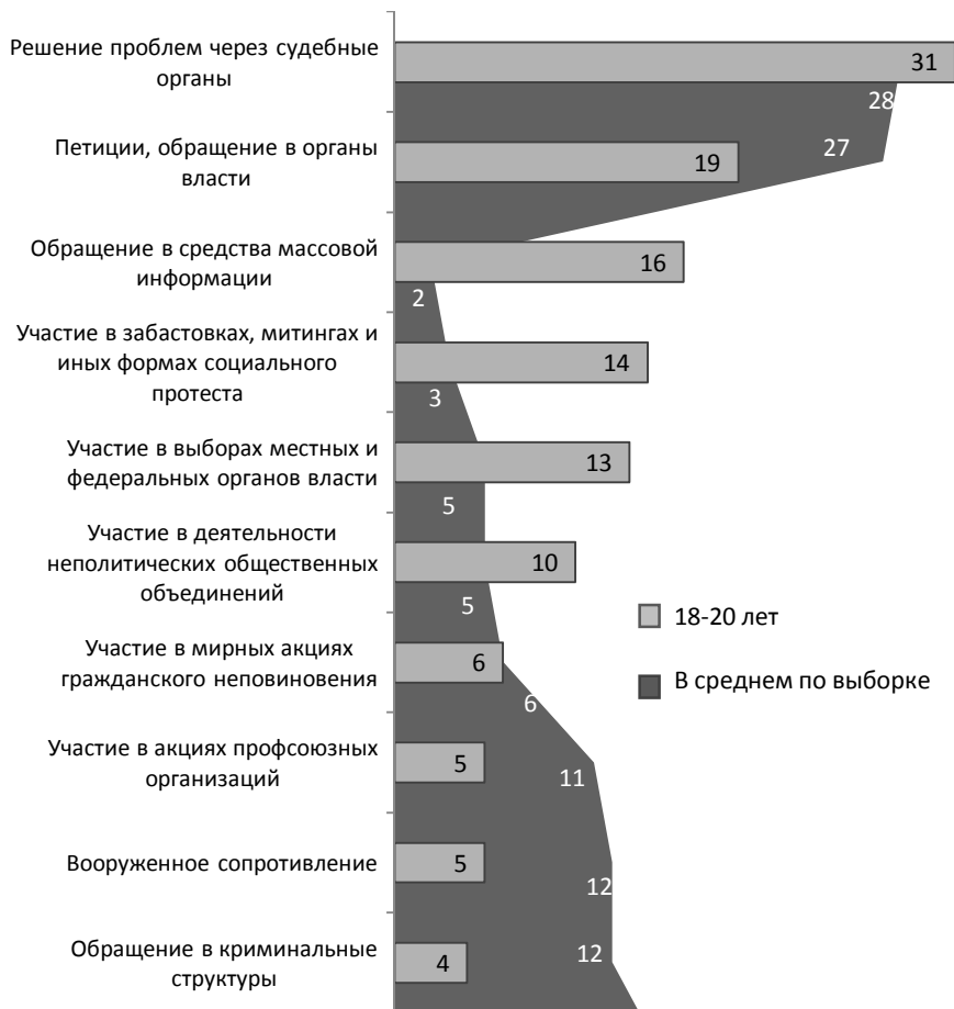
Рис. 2. Способы защиты прав в случае их ущемления (любое число вариантов ответа), %