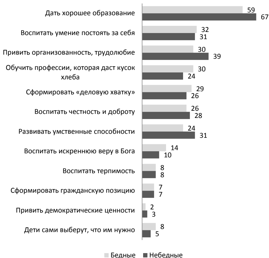
Рис. 3. Взгляды россиян на то, что является главным в воспитании детей в современных условиях, 2013 г., %

В целом, как для бедных, так и для остальных россиян главным является стремление дать детям хорошее образование (об этом говорят две трети представителей этих групп). Однако это скорее декларации, чем реальные действия, т. к. образовательными услугами в целом пользовались семьи всего 7% бедных и 19% небедных россиян.