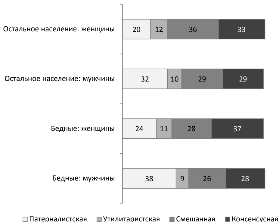
Рис. 1. Запрос к типу семьи у мужчин и женщин, 2009 г., %

Следует отметить, что консенсусная модель также предполагает наличие больших возможностей для конфликтов при принятии каждого решения. Особенно, если представления о центре принятия решения у супругов не совпадают. А запрос к типу семьи у бедных, как и у остального населения среди мужчин и женщин, несколько различен 1 (см. рис. 1): если мужчины считают, что решения в семье должен принимать мужчина, то наиболее популярная модель среди женщин из числа бедных – консенсусная (37%).