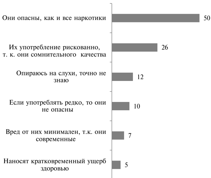
Рис. 4. Отношение к «новым наркотикам» российских студентов, %

Основной причиной перехода к «новым наркотикам», которые считаются «легальными» является, с точки зрения потребителей, безопасность их употребления (см. рис.4). При этом данные проведенного исследования свидетельствуют о том, что периоды воздержания у потребителя свидетельствуют не о безопасности наркотизации, а об остатках его воли и свободы, и речь идёт лишь об отложенных сроках формирования наркозависимости.