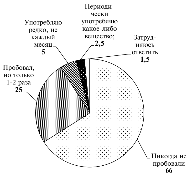
Рис. 3. Употребление наркотиков российскими студентами, %

Полученные материалы позволили, с одной стороны, выделить группы повышенного риска («пробовальщики»), с другой стороны – сформировать те группы потребителей наркотиков («эпизодическое потребление»), которые вовлечены в «новую» волну наркотизации (см. рис.3). Для них характерно «контролируемое» потребление, которое выражается в ситуативном и/или «статусном» и/или «рекреационном» потреблении ПАВ.