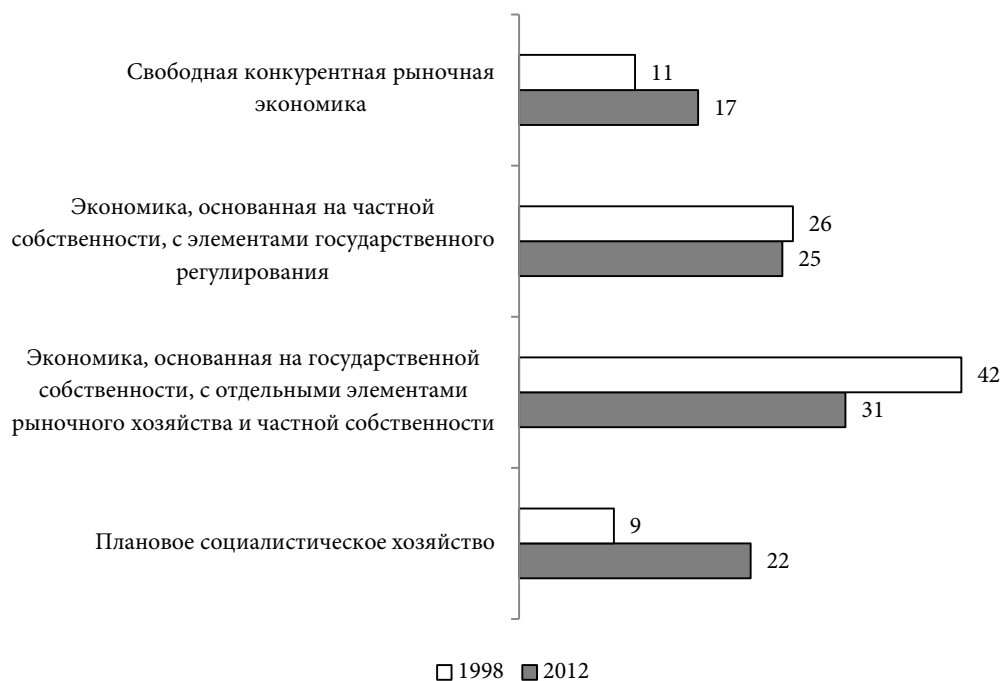
Рис. 2. Каким должен быть, по мнению населения, экономический строй в России, 1998-2012 гг., % (на рисунке не указаны затруднившиеся с ответом)

рыночной экономики и сторонников плановой экономики социалистического типа (см. рис. 2). Таким образом, и в этом отношении можно говорить о нелинейности процесса культурной динамики и поляризации населения страны по представлениям об оптимальном общественном устройстве.