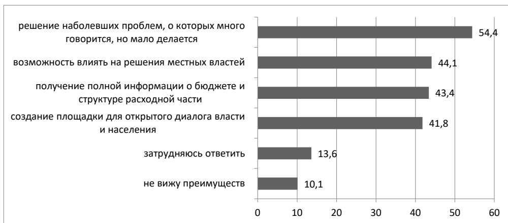
Рис. 2. Распределение ответов на вопрос: «Какие преимущества использования механизма инициативного бюджетирования Вы видите?»,%

Fig. 2. Distribution of answers to the question: “What benefits of using the initiative budgeting mechanism do you see?”,%