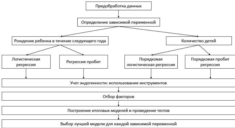
ис. 2. Алгоритм построения регрессионных моделей Fig. 2. Algorithm for building regression models