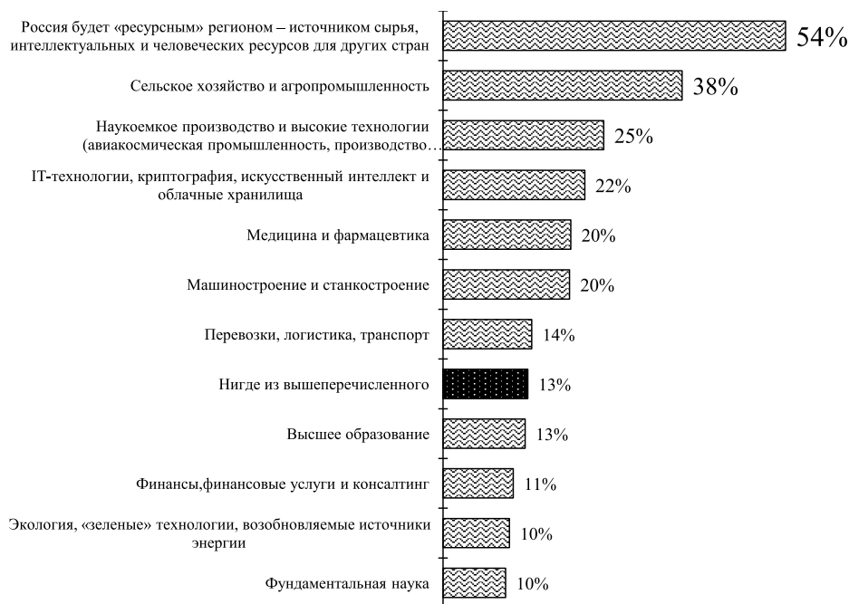
Рис. 3. Представления взрослой молодежи о будущем российской экономики через 10–15 лет 3 , в % от опрошенных (неограниченное количество ответов, n=550)

Fig. 3. Views of adult youth about the future of the Russian economy in 10–15 years, in % of respondents (unlimited number of responses, n=550)