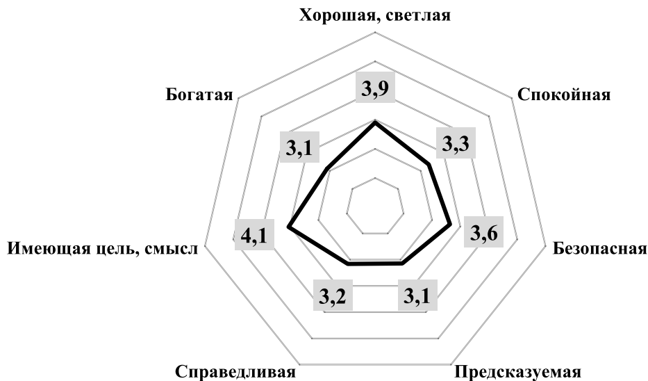
Рис. 2. Представления взрослой молодёжи о жизни в России через 10–15 лет*, в средних оценках от 1 до 7 по каждому параметру** (n=550)

Fig. 2. The views of adult youth about life in Russia in 10–15 years, in average estimates from 1 to 7 for each parameter (n=550)