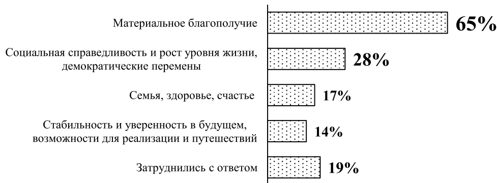
Рис. 1. Представления молодёжи о «русской мечте»*, в % от опрошенных (открытый вопрос, n=550)

Вызывают беспокойство оценки опрошенной молодёжи в отношении будущего российской экономики на горизонте в 10–15 лет. Так, абсолютное большинство — 54% респондентов ответило, что Россия останется «ресурсным» регионом — источником сырья, а также интеллектуальных и человеческих ресурсов для других стран. Данный факт говорит о том, что ожидания перехода к производительной экономике и созданию условий для реализации человеческого потенциала на территории нашей страны у респондентов мало. Вера в развитие таких жизненно важных сфер, определяющих статус экономики, как финансовый рынок и финансовые технологии, «зелёные» технологии и экология, фундаментальная наука и высшее образование, медицина и фармацевтика — присутствует среди 10–20% молодой аудитории (в зависимости от направления, см. рис. 3).