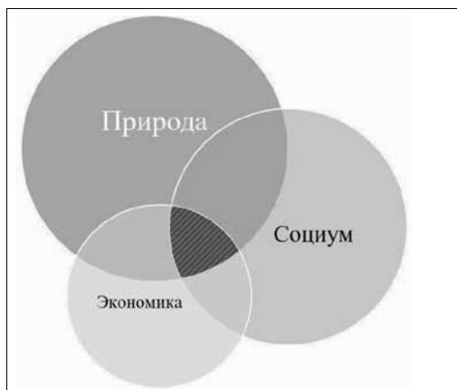
Рис. 1. Традиционное графическое представление пересечения трёх подсистем Fig. 1. Graphical representation of the intersection of three subsystems

ет экономическую деятельность. Очевидно, что экономическая, социальная, природная подсистемы взаимосвязаны, их развитие взаимообусловлено, они образуют единое целое. Однако с точки зрения экономики, ей отводится главенствующая роль, а природе и обществу — второстепенная. Поэтому-то обычно считается, что природа, общество, экономика образуют социо-эколого-экономическую систему на равных — как пересечение трёх подсистем (рис. 1).