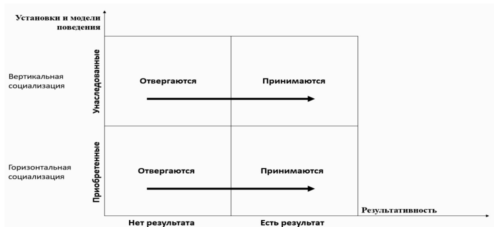
Рис. 1. Механизм культурной трансмиссии

финансово-экономических и социальных аспектов культуры как в детстве, так и во взрослом возрасте, во многом зависят от обстоятельств, в которых родились и выросли индивиды. Такие обстоятельства являются продуктом семей, школ и территорий; сверстники и взрослые, с которыми дети проводят время; образы средств массовой информации, которые формируют их восприятие себя и своего места в мире; и другие факторы — как внутренние, так и внешние по отношению к отдельному ребенку, человеку. Исходя из этого, набор финансово-экономических ценностей и убеждений определяется, с одной стороны, вертикальной социализацией, то есть воспитанием, а, с другой стороны — горизонтальной социализацией, то есть личным опытом взаимодействия с окружающим миром (рис. 1).