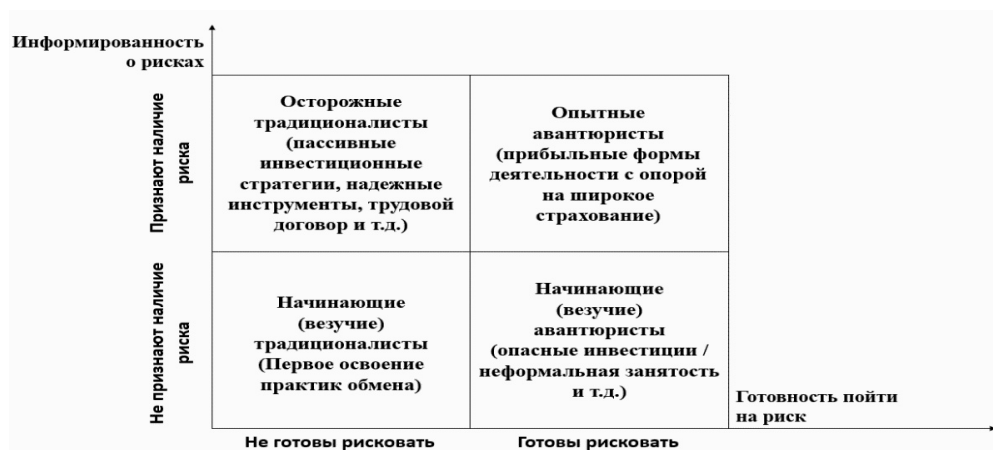
Рис. 2. Применение теории культурной трансмиссии к восприятию риска в финансово-экономической сфере