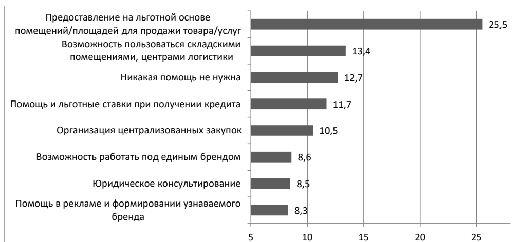
Рис. 3. Распределение ответов на вопрос «Какую помощь, прежде всего, Вы бы хотели получать от союзов потребительских обществ, поддерживающих кооперативы?», %

Fig. 3. Distribution of responses to the question «What kind of assistance would you primarily like to receive from consumer society unions that support cooperatives?», %