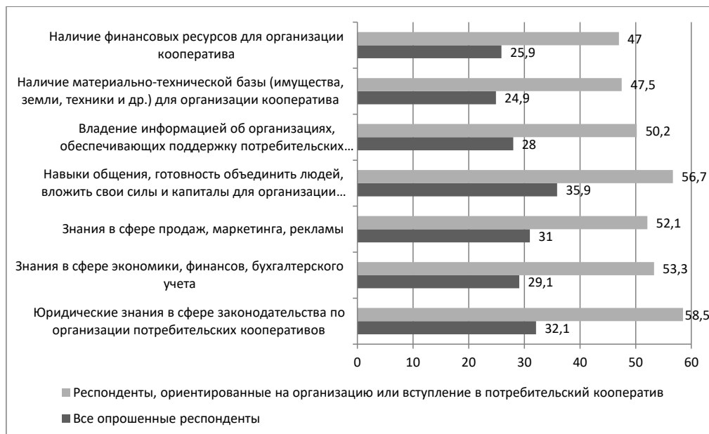
Рис. 2. Распределение ответов на вопрос «Оцените у себя наличие знаний и ресурсов, необходимых для организации или вступления в потребительский кооператив» (на рисунке отражен процент респондентов, выбравших вариант ответа «высокий» при ответе на данный вопрос), %

Fig. 2. Distribution of responses to the question «Assess your availability of knowledge and resources necessary for organizing or joining a consumer cooperative» (the figure shows the percentage of respondents who chose the «high» answer option when answering this question), %